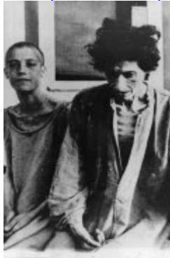
Затворнички от концентрационен лагер Равенсбрюк; 1945 г. след освобождаването на лагера (IPN) Затворнички от концентрационен лагер Равенсбрюк; 1945 г. след освобождаването на лагера (IPN)