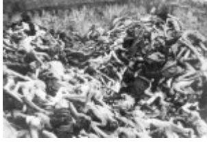
Концентрационен лагер Берген-Белзен - общ гроб на убити затворници; април 1945 г. след освобождаването на лагера (IPN) Концентрационен лагер Берген-Белзен - общ гроб на убити затворници; април 1945 г. след освобождаването на лагера (IPN)