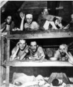
Концентрационен лагер Бухенвалд - бивши затворници на нарове в лагера; април 1945 г., след освобождаването на лагера (IPN) Концентрационен лагер Бухенвалд - бивши затворници на нарове в лагера; април 1945 г., след освобождаването на лагера (IPN)