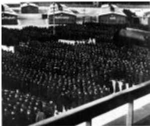
Концентрационен лагер Заксенхаузен - апел на лагерния плац, на заден план върху бараките се вижда фрагмент от надпис, вероятно със следното съдържание: "Esgibtnureinen Wegzur Freiheit, seine Meilensteine heissen: Gehorsam-Fleiss-Ehrlichkeit-Ordnung-Sauber Концентрационен лагер Заксенхаузен - апел на лагерния плац, на заден план върху бараките се вижда фрагмент от надпис, вероятно със следното съдържание: "Esgibtnureinen Wegzur Freiheit, seine Meilensteine heissen: Gehorsam-Fleiss-Ehrlichkeit-Ordnung-Sauberkeit-Nüchternheit-Wahrhaftigkeit-Opfersinn und Liebe zum Vaterland" („Има само един път към свободата и неговите крайъгълни камъни се наричат: подчинение - усърдие - честност - ред - чистота - трезвост - откровеност -жертвоготовност и любов към родината"); 1939 г. (IPN)